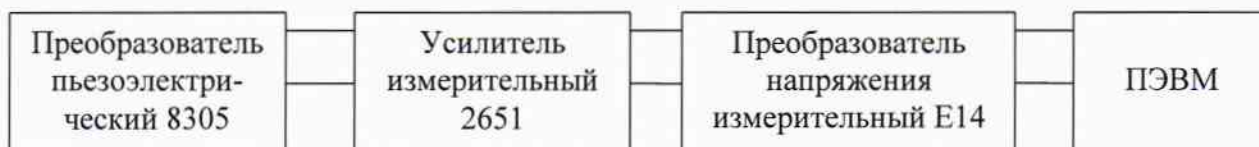
Рисунок 2. Схема подключения преобразователя.

2.8.3.2 Поместить датчик вибрации и преобразователь пьезоэлектрический 8305 (далее – преобразователь) на виброплатформу вибростенда Bruel & Kjaer 4812. Собрать схему, приведенную на рис.1. Преобразователь подключить по схеме, приведенной на рис.2.