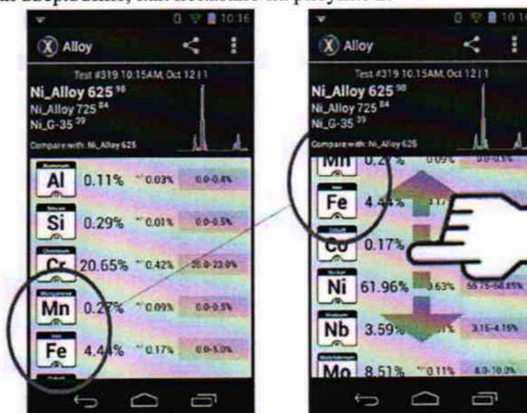
Рисунок 2 – Обозначение способа перелистывания полученных при измерении результатов

Для этого, необходимо поднести анализатор измерительным окном вплотную к измеряемому образцу ГСО и нажать курок. На сенсорном экране анализатора появятся данные всех определенных образцов и их массовая доля. Необходимый элемент можно найти, пролистав экран вверх/вниз, как показано на рисунке 2.