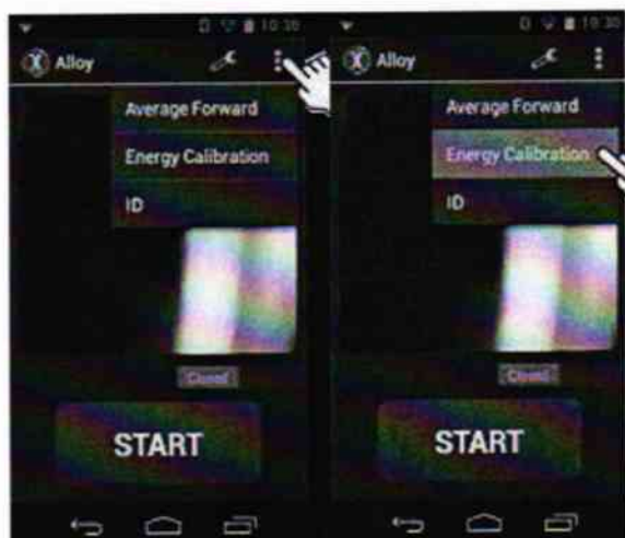
Рисунок 1 – Вид вызова меню «Энергетической калибровки»

8.3.2 В качестве измеряемого образца используется встроенный в прибор защитный затвор. Для запуска процедуры нажмите на выпадающее меню в правом верхнем углу – «три точки», а затем выберите «Энергетическую калибровку» («Energy Calibration») (см. рис. 1).