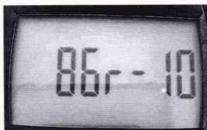
Рисунок 1 — Идентификация ПО

На экране отобразится номер версии ПО (рисунок 1).