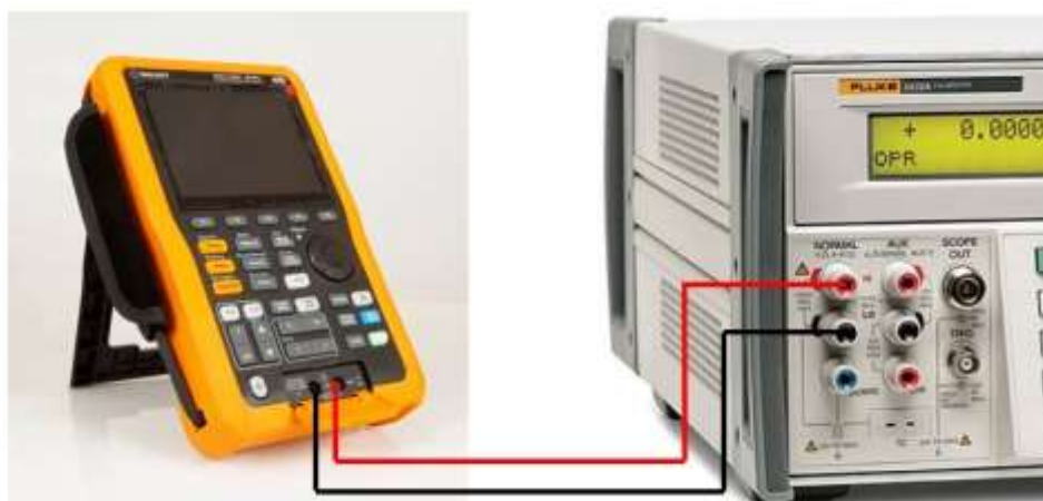
Рисунок 3 – Схема соединения приборов при определении погрешности измерения напряжения постоянного и переменного тока, электрического сопротивления постоянному току, электрической емкости

9.6.2 Подключить осциллограф-мультиметр к калибратору согласно рисунку 3.