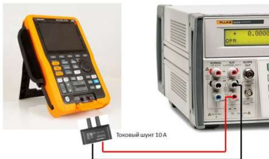
Рисунок 5 – Схема соединения приборов при определении погрешности измерения силы постоянного и переменного тока на пределах 6 А и 10 А