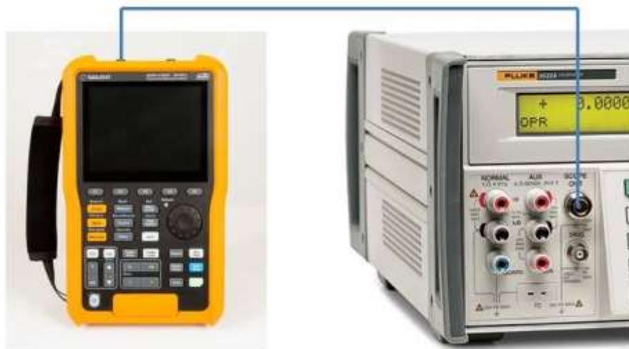
Рисунок 1 - Схема соединения приборов при определении погрешности измерения напряжения постоянного тока и коэффициентов отклонения, определении погрешности измерения импульсного напряжения, проверке ширины полосы пропускания каналов

9.1.1 Подключить калибратор к входу канала осциллографа-мультиметра согласно рисунку 1.