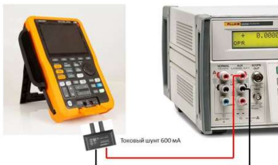
Рисунок 4 – Схема соединения приборов при определении погрешности измерения силы постоянного и переменного тока на пределах 60 и 600 мА

9.10.3 На калибраторе установить поочередно значения силы постоянного и переменного тока в соответствии с таблицами 13 – 14. Зафиксировать показания осциллографа-мультиметра и занести их в соответствующую таблицу.