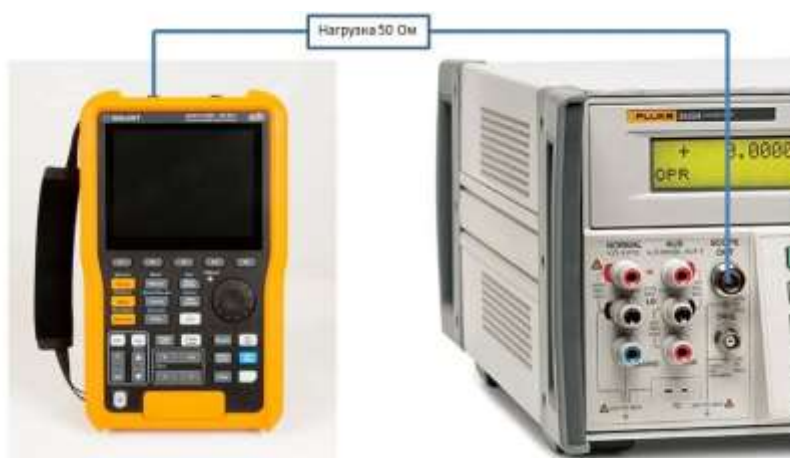
Рисунок 2 – Схема соединения приборов при определении времени нарастания переходной характеристики и определении относительной погрешности частоты внутреннего опорного генератора.

9.4.5 Повторить измерения по п.п. 9.4.1 – 9.4.5 для коэффициентов отклонения, устанавливаемых из ряда: 5, 10, 20, 50, 100, 200, 500 мВ/дел, 1 В/дел.