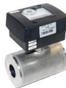
Рисунок 2 - Внешний вид преобразователей с ЭБ исполнения 2