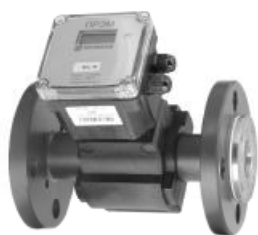
Рисунок 1 - Внешний вид преобразователей с ЭБ исполнения 1