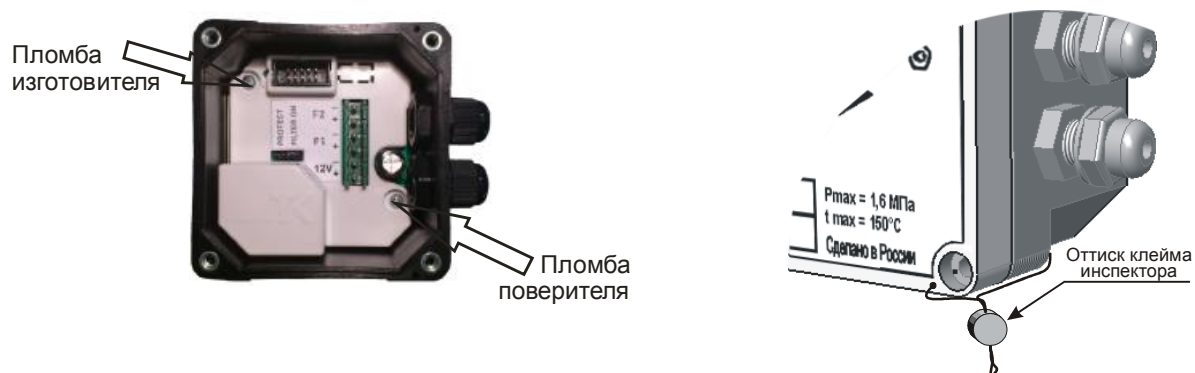
Рисунок 4 - Места пломбирования ЭБ исполнения 1

В целях предотвращения доступа к узлам регулировки и настройки, а также к элементам конструкции, предусмотрены места пломбирования, указанные на рисунках 4 и 5.