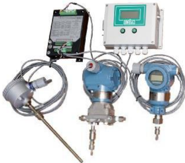
Фото 1 - Общий вид комплекса измерительного "СуперФлоу-21В"

На фото 1 приведен общий вид комплекса измерительного «СуперФлоу-21В».