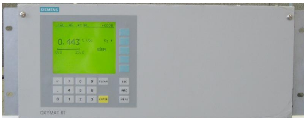
Рисунок 3 – Газоанализатор Oxymat 61, внешний вид