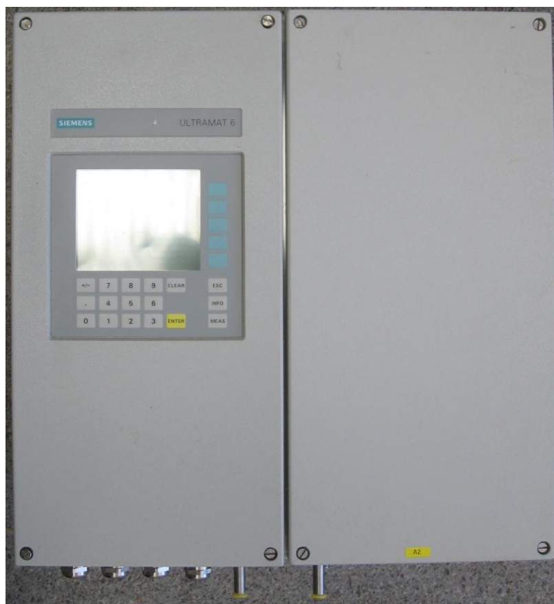
Рисунок 2 – Газоанализатор Ultramat 6F, внешний вид