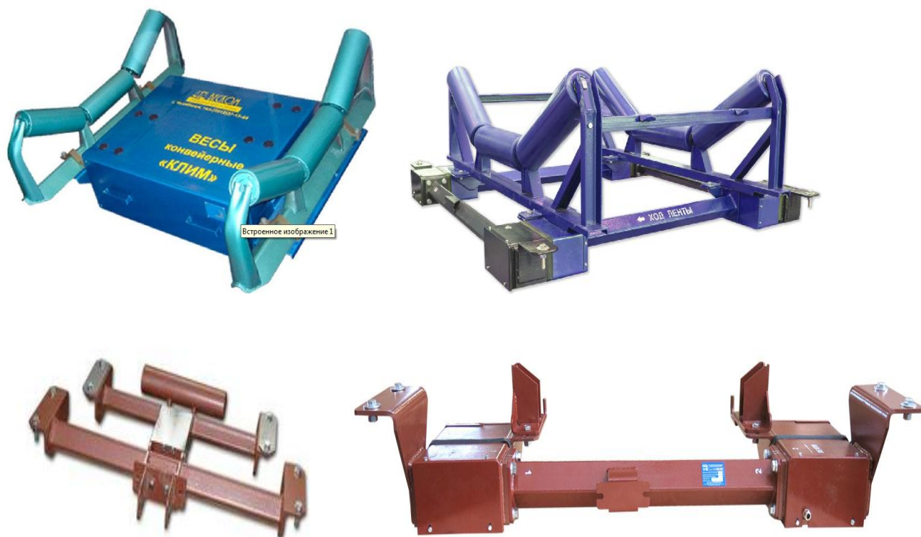
Рисунок 1 – Общий вид ГПУ весов