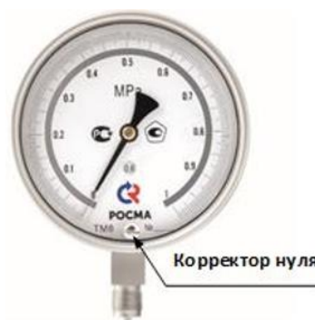
Рисунок 8 – Манометры показывающие ТМ, ТВ, ТМВ серия 21 Р.МТИ для точных измерений