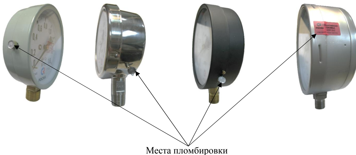
Рисунок 13 - Схемы пломбировки приборов от несанкционированного доступа

Защита от несанкционированного доступа осуществляется при помощи опломбирования корпуса прибора пломбой. Также возможно пломбирование путем нанесения на кольцо и боковую поверхность корпуса прибора специальной наклейки, которая разрушается при попытке ее удалить и вскрыть корпус или пломбирование с использованием пломбировочной чашки. Опломбирование корпуса ограничивает доступ к внутренним элементам конструкции. Схемы пломбировок, предотвращающих доступ к элементам конструкции, представлены на рисунке 13. Обозначение места нанесения знака поверки представлено на рисунке 14.