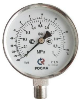
Рисунок 5 – Манометры показывающие ТМ, ТМВ серия 11