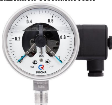
Рисунок 11 – Манометры показывающие ТМ, ТВ, ТМВ серия 21 с электроконтактной приставкой (ЭКП)