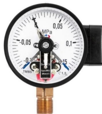
Рисунок 2 – Манометры показывающие ТМ, ТВ, ТМВ серия 10 с электроконтактной приставкой (ЭКП)