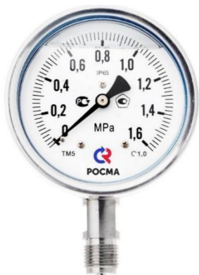
Рисунок 7 – Манометры показывающие ТМ, ТВ, ТМВ серия 21