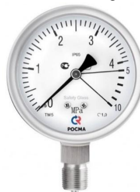
Рисунок 10 – Манометры показывающие ТМ, ТВ, ТМВ серия 21 с защитой от перегрузки