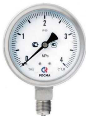
Рисунок 9 – Манометры показывающие ТМ, ТВ, ТМВ серия 21 с повышенной безопасностью