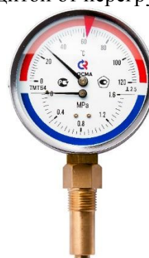
Рисунок 12 – Манометры показывающие ТМТБ (термоманометр)