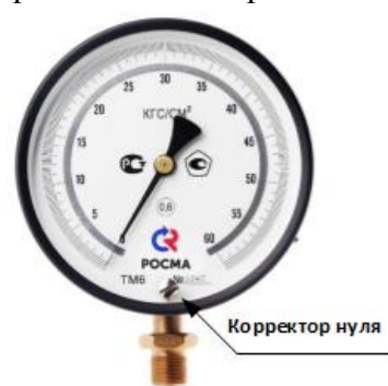
Рисунок 4 – Манометры показывающие ТМ, ТМВ серия 10 Р.МТИ для точных измерений