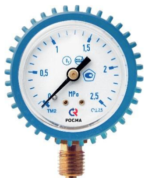
Рисунок 3 – Манометры показывающие ТМ, серия 10, газовые