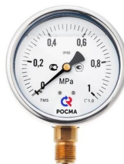
Рисунок 6 – Манометры показывающие ТМ, ТВ, ТМВ серия 20