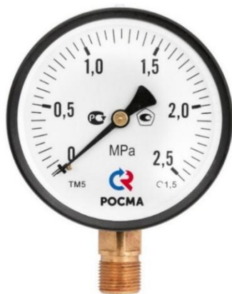
Рисунок 1 – Манометры показывающие ТМ, ТВ, ТМВ серия 10

Общий вид приборов представлен на рисунках 1 - 12.