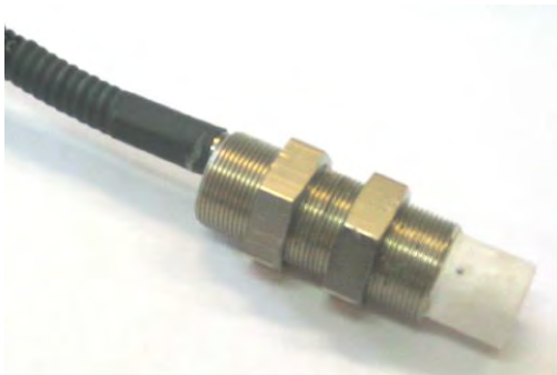
со встроенным усилителем

Фотографии общего вида частей тахометра представлены на рисунке 1. Схемы пломбировки от несанкционированного доступа изображены на рисунке 2.