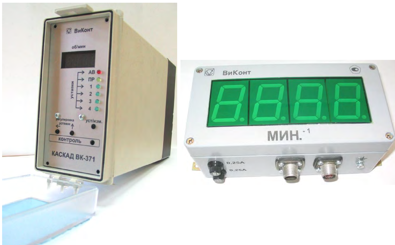
Рисунок 16. Фотографии общего вида вторичного блока и выносного табло.