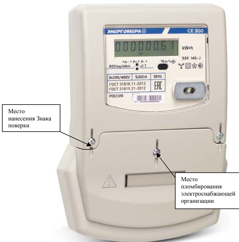
Рисунок 2 - Внешний вид счетчика CE300 S33