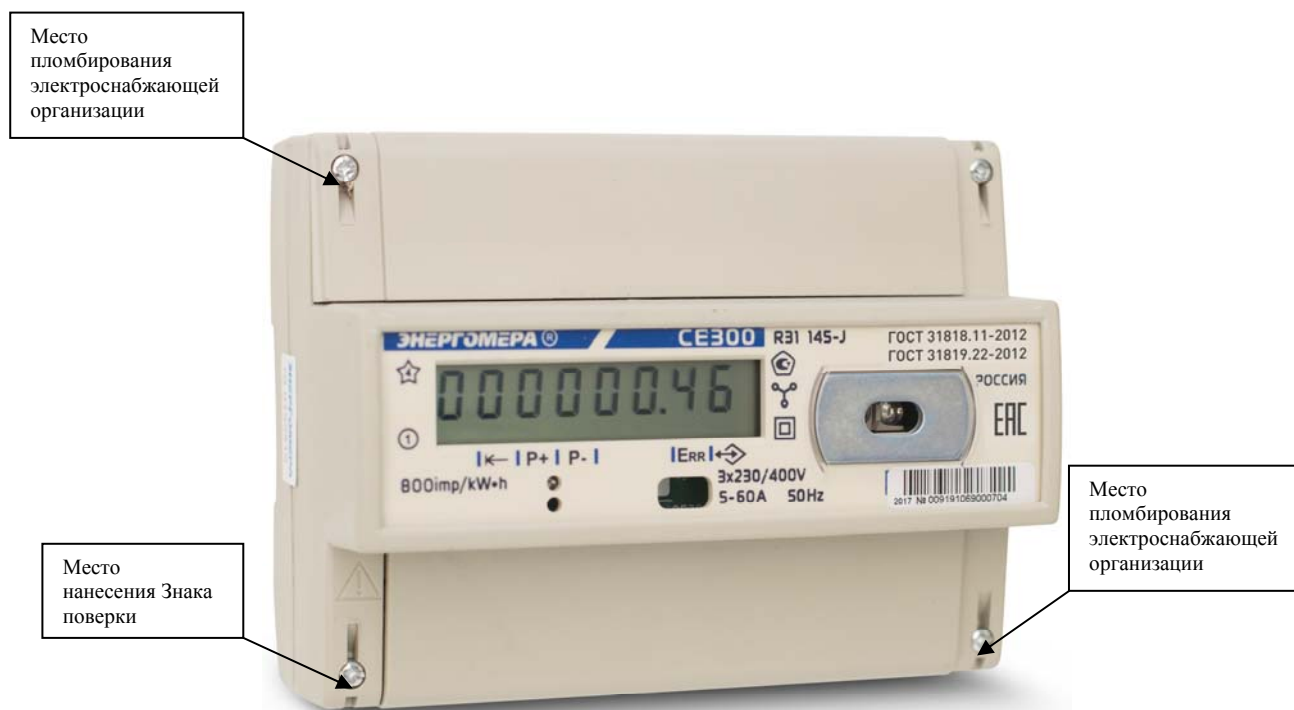
Рисунок 3 - Внешний вид счетчика CE300 R31