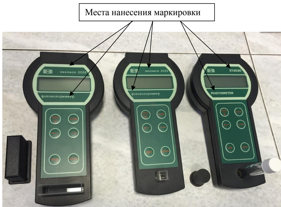
Рисунок 1 - Общий вид фотоколориметров «ЭКОТЕСТ-2020» с обозначением мест нанесения маркировки

Слева - модификация «ЭКОТЕСТ-2020-МЦ» с отсеком для кюветы 50 мм, в центре - модификации «ЭКОТЕСТ-2020-1», «ЭКОТЕСТ-2020-4», «ЭКОТЕСТ-2020-8» с отсеком для квадратной кюветы 10 мм, справа - модификации «ЭКОТЕСТ-2020-ХПК» с отсеком для круглой кюветы диаметром 16 мм, «ЭКОТЕСТ-2020-8-ХПК» с отсеком для круглой кюветы диаметром 16 мм и квадратной кюветы 10 мм