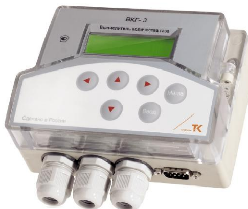
Рисунок 1 - Общий вид вычислителя

В целях предотвращения несанкционированного доступа к узлам регулировки и настройки и ПО, а также к элементам конструкции, предусмотрены места пломбирования, указанные на рисунке 3.