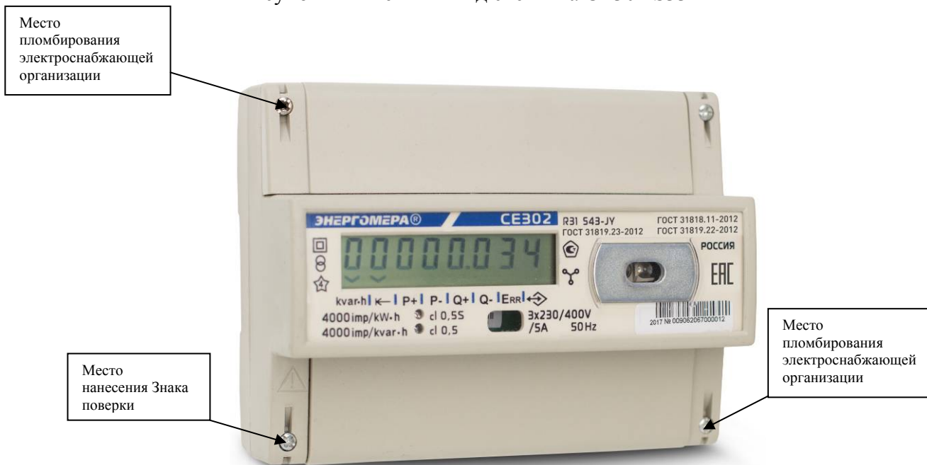
Рисунок 3 - Внешний вид счетчика CE302 R31