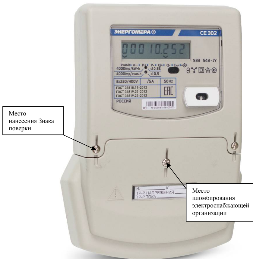
Рисунок 2 - Внешний вид счетчика CE302 S33