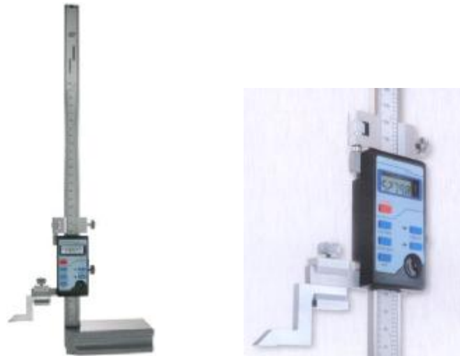
Рисунок 2 - Общий вид штангенрейсмасов цифровых и рамка с цифровым отсчетным устройством с кнопками.