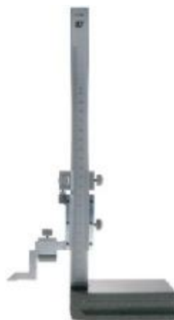
Рисунок 1 - Общий вид штангенрейсмасов нониусных.

Все подвижные элементы штангенрейсмасов снабжены стопорными винтами.