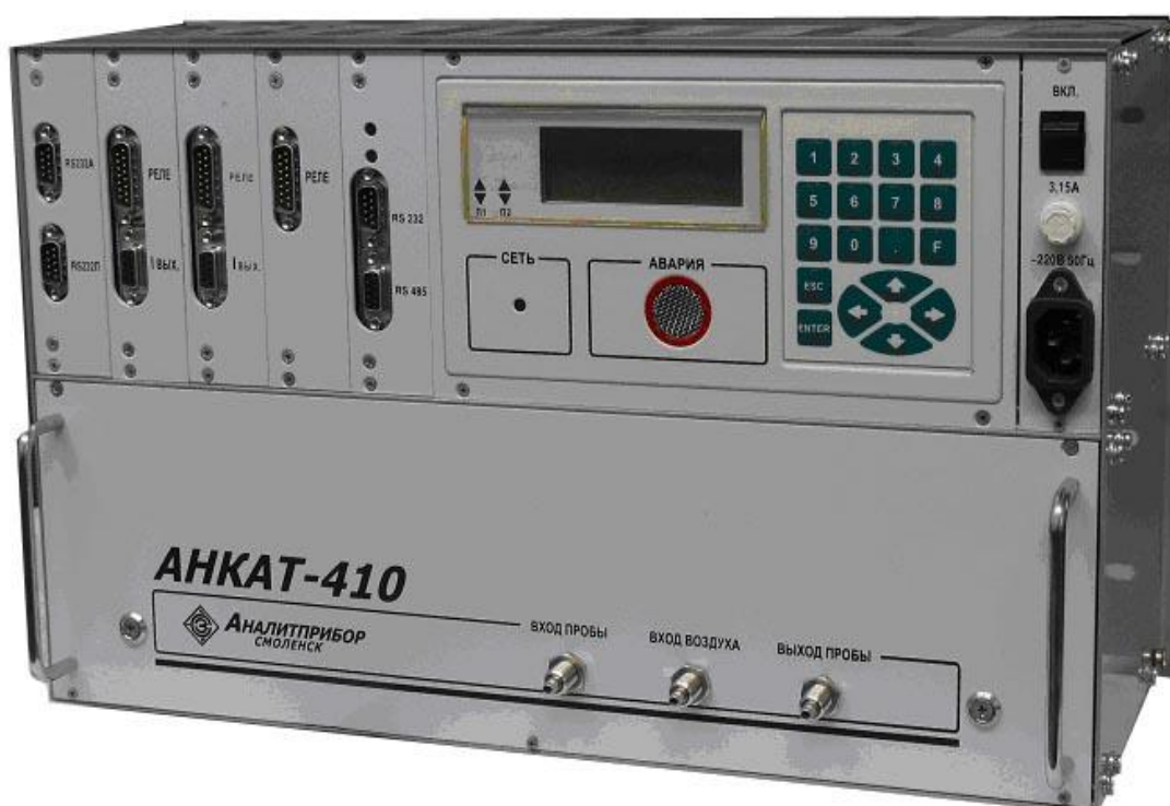
Рисунок 2 - Внешний вид газоанализаторов

Внешний вид газоанализаторов показан на рисунке 2.