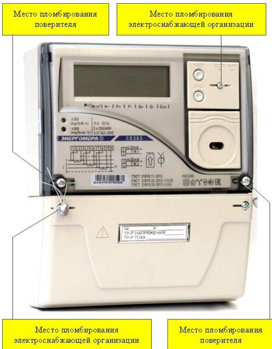
Рисунок 3 - Общий вид счетчика CE 303 S31