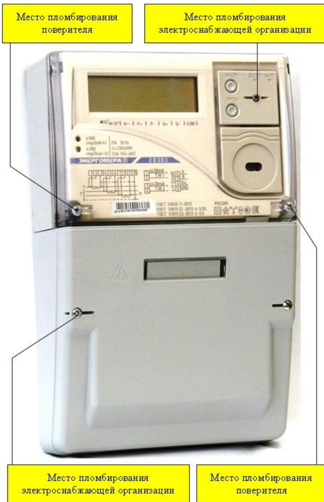
Рисунок 5 - Общий вид счетчика CE 303 S34