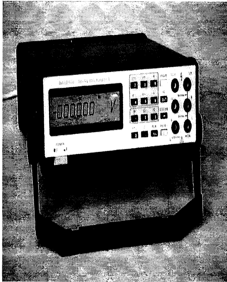
Рисунок 1 – Общий вид вольтметров

Общий вид вольтметров приведен на рисунке 1.