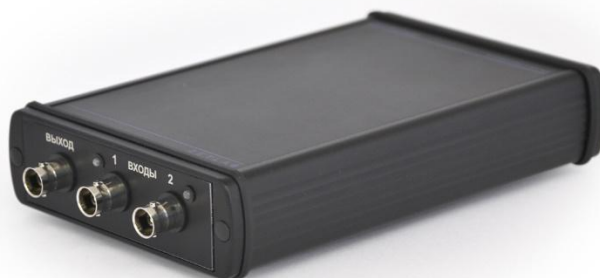
Рисунок 5 - Внешний вид анализатора спектра ZET 017-U2