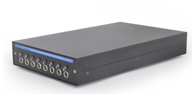
Рисунок 2 - Внешний вид анализатора спектра ZET 017-P8