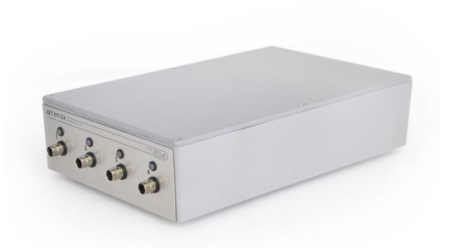
Рисунок 1 - Внешний вид анализатора спектра ZET 017-C4