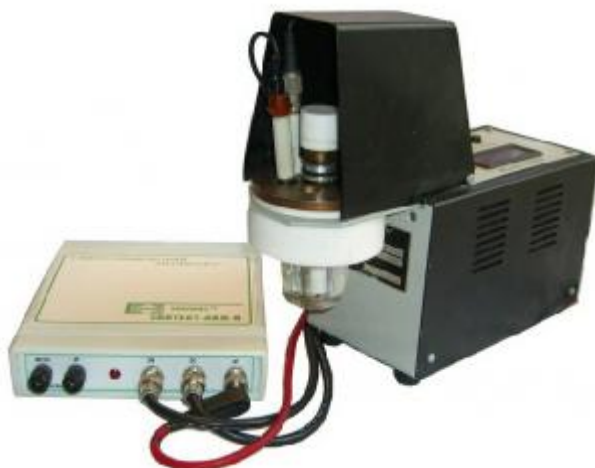
Рисунок 2 Внешний вид анализатора «ЭКОТЕСТ-АВЛ»

В зависимости от режимов работы и технических характеристик анализаторы поставляются в трех модификациях: «ЭКОТЕСТ-АВЛ-В» – обеспечивает работу в режиме переменноточковой квадратноволновой прямой и инверсионной вольтамперометрии с накоплением по одному измерительному каналу; «ЭКОТЕСТ-АВЛ-П1» и «ЭКОТЕСТ-АВЛ-П2» – представляют собой универсальный одно- или двухканальный потенциостат/гальваностат с широким набором технических характеристик и режимов работ. Данные модификации отличаются выходными параметрами.