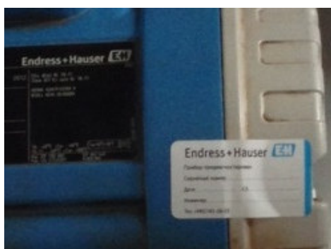
Рисунок 3 - Схема пломбирования корпуса преобразователя давления и уровня Deltapilot

Для применения преобразователя давления и уровня Deltapilot в учетно-расчетных операциях переключатель заклеивается маркой поверителя, также конструктивно предусмотрено пломбирование корпуса пломбами надзорного органа (рисунок 3).