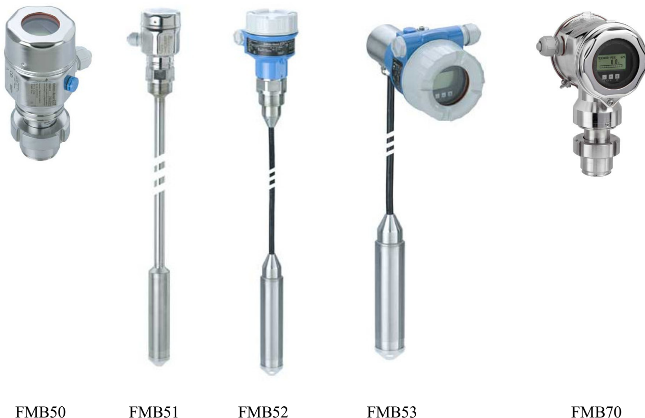
Рисунок 1 - Фотография общего вида средства измерений

Преобразователи Deltapilot могут применяться в различных отраслях промышленности (в том числе в пищевой промышленности) в системах управления технологическими процессами, при учетно-расчетных операциях, а также в автономном режиме.