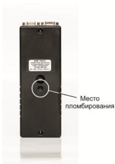
Рисунок 2 – Измерители дымности отработавших газов МЕТА-01МП (вид сзади), обозначение мест пломбирования и маркировки.