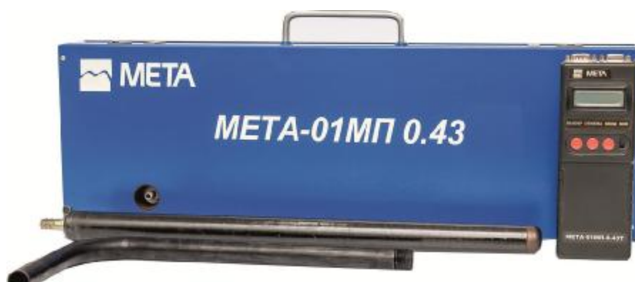
Рисунок 1б - Внешний вид измерителей дымности отработавших газов МЕТА-01МП, модификации МЕТА-01МП 0.43