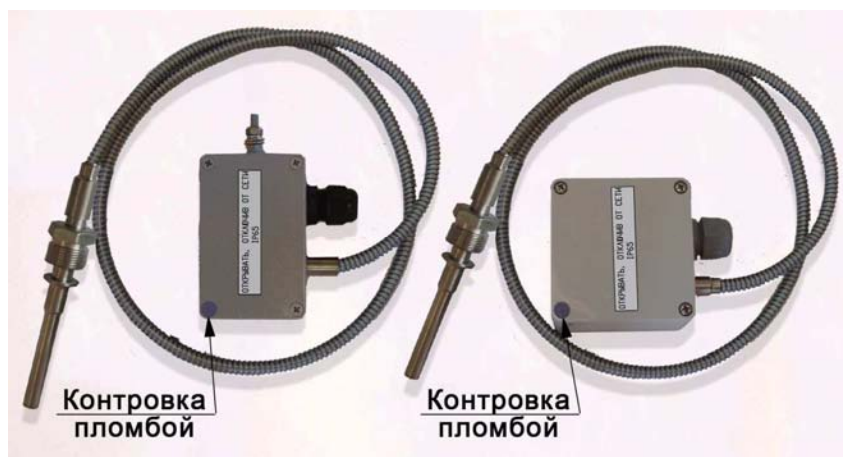
Погружаемые термопреобразователи с соединительным кабелем с видом взрывозащиты «Искробезопасная электрическая цепь» по ГОСТ Р 51330.10-99