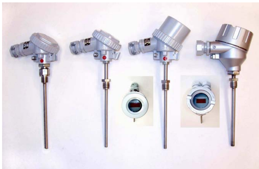
Погружаемые термопреобразователи с видом взрывозащиты «Взрывонепроницаемая оболочка» по ГОСТ Р 51330.1-99, в том числе с ЦД