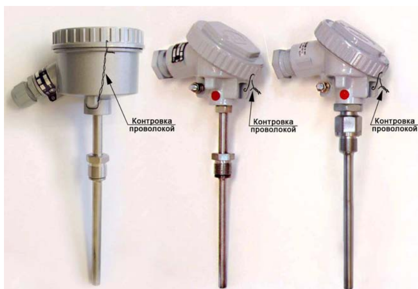
Погружаемые термопреобразователи с видом взрывозащиты «Искробезопасная электрическая цепь» по ГОСТ Р 51330.10-99