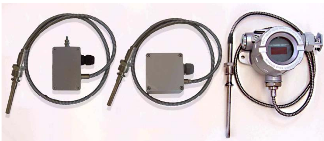
Погружаемые общепромышленные термопреобразователи с соединительным кабелем, в том числе с ЦД