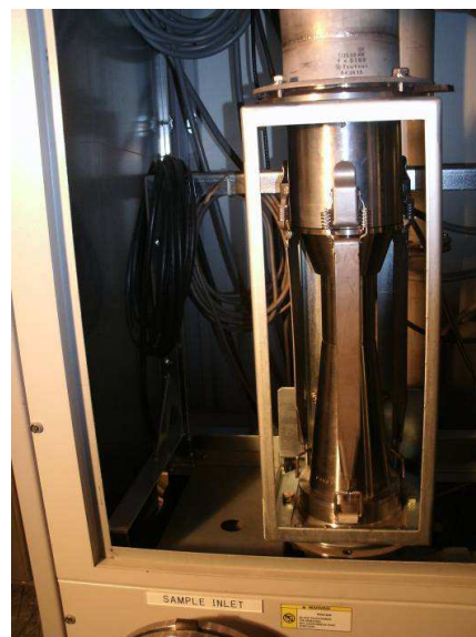
Т-образный смесительный блок