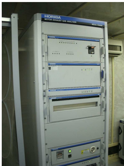
Блок управления МЕХА-7200Н