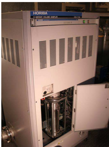
Блок для отбора выхлопных газов

На рисунке 1 представлены внешние виды блоков, входящих в состав системы.