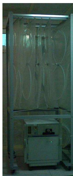
Блок отбора проб в пакеты