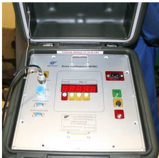
Рис. 2. Общий вид приборного блока