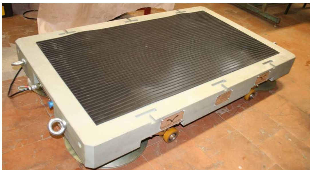
Рис. 1. Общий вид весоизмерительной платформы

Масса определяется как сумма показаний всех весоизмерительных платформ и индицируется на индикаторном табло приборного блока.