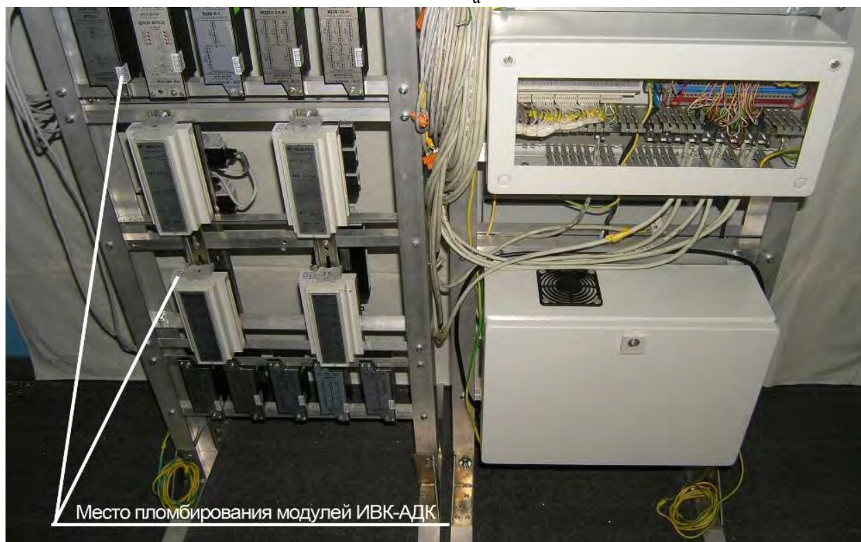
Рисунок 1-Фото общего вида ИВК со схемой пломбировки и обозначением мест для отсисков клейм или наклеек (а-вид спереди, б-вид сзади)