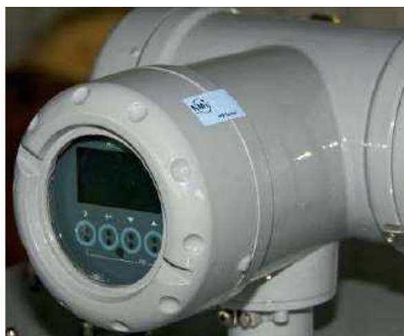
Рисунок 3 - Пломбирование корпуса счетчика

Кроме этого корпус счетчика может быть опломбирован для исключения возможности доступа к внутренним компонентам прибора (Рисунок 3).