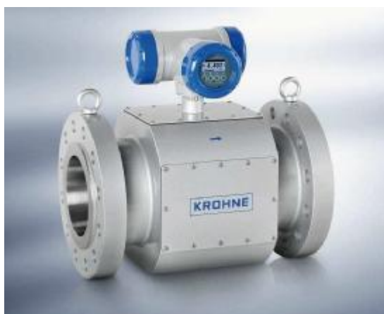
Рисунок 1- Общий вид счетчика

Общий вид счетчика приведен на рисунке 1.