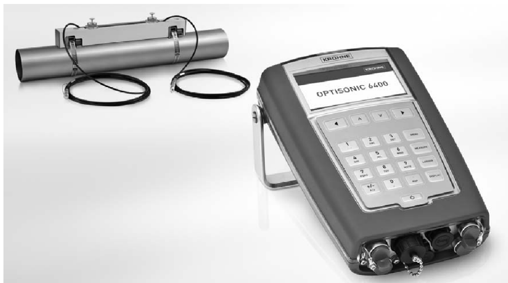
Внешний вид расходомеров ультразвуковых OPTISONIC 6400

Первичные преобразователи OPTISONIC 6000 устанавливаются на внешней образующей трубопровода посредством крепления металлическими (или текстильными) лентами. Для эффективности работы контактная поверхность первичного преобразователя предварительно обрабатывается силиконовой смазкой.