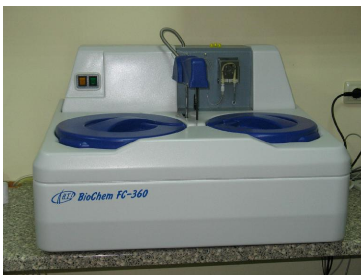
Рисунок 2 – Общий вид анализатора модель FC-360