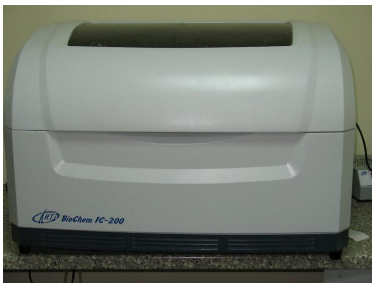
Рисунок 1 – Общий вид анализатора модель FC-200