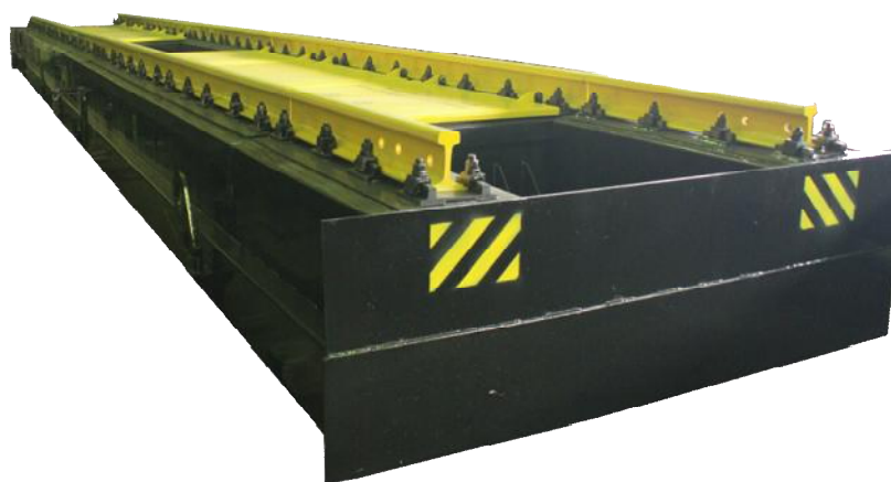
Рисунок 1 – Пример общего вида весов

Общий вид ГПУ весов приведен на рисунке 1, а терминалов – на рисунке 2.