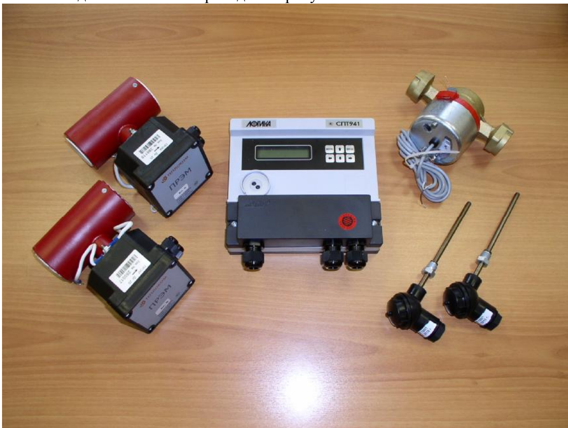
Рисунок 1 – Внешний вид теплосчетчика

Внешний вид теплосчетчика приведен на рисунке 1.