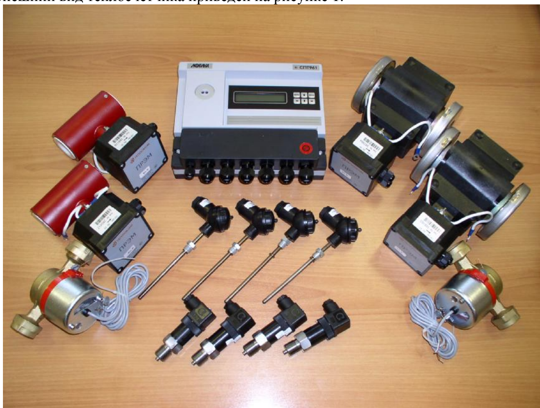
Рисунок 1 – Внешний вид теплосчетчика

Внешний вид теплосчетчика приведен на рисунке 1.