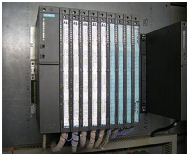
Рисунок 6 – Контроллер программируемый Simatic S7-400