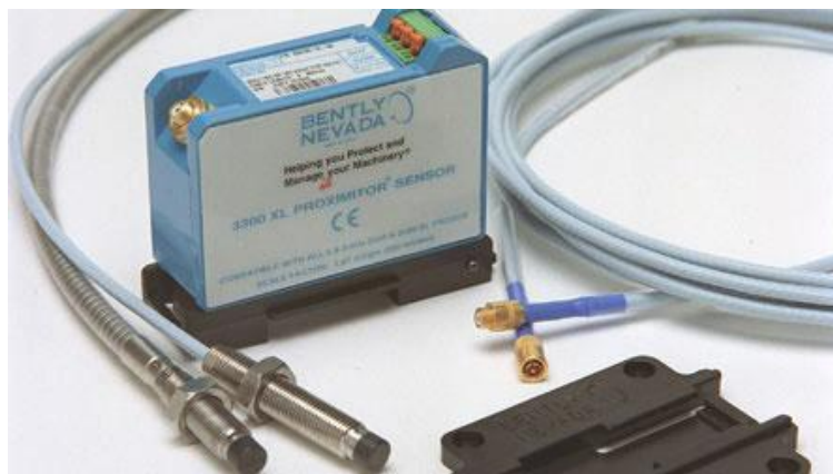
Рисунок 3 – Преобразователь перемещения токовихревой VN 3300