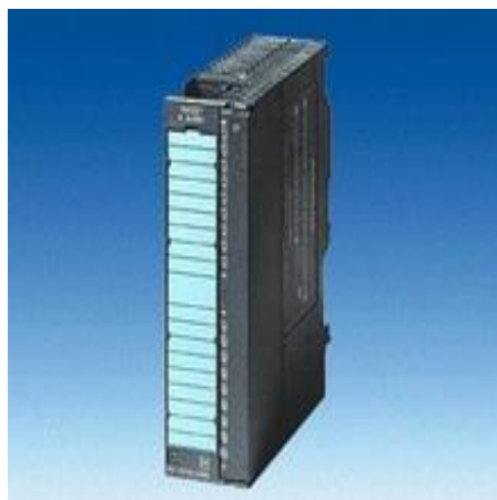
Рисунок 5 – Устройство распределенного ввода-вывода Simatic ET 200