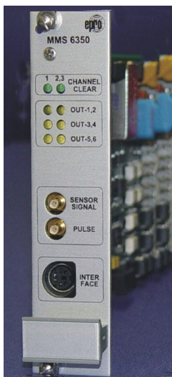
Рисунок 7 – Модуль измерения скорости вращения MMS 6350