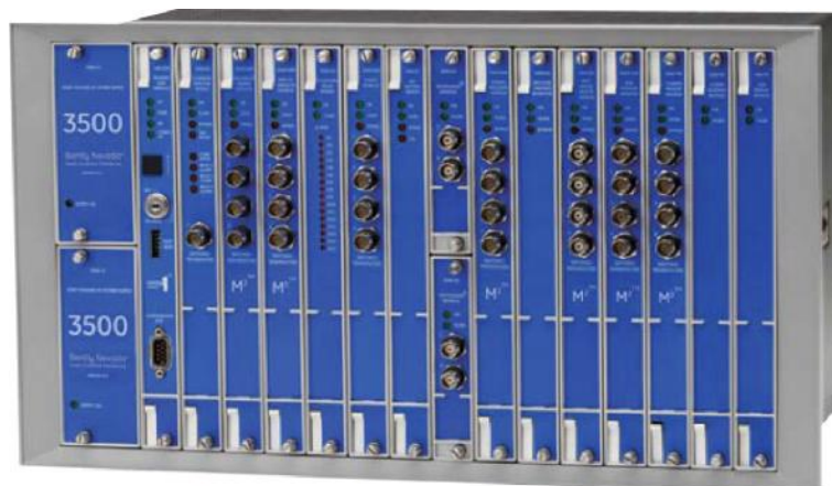
Рисунок 8 – Комплекс измерительно-вычислительный для мониторинга работающих механизмов BN-3500.