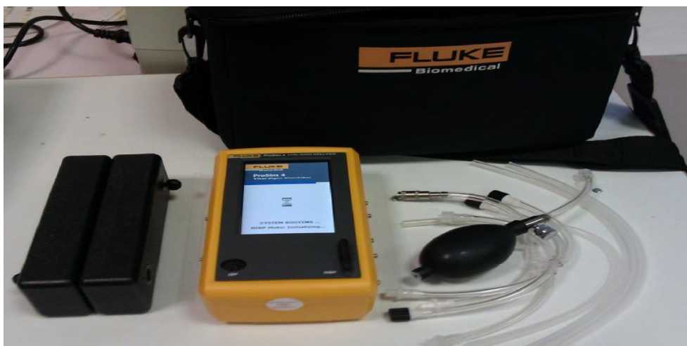
Рис. 1. Генератор сигналов пациента ProSim 4.