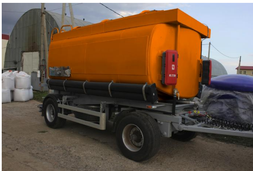
Рисунок 1 - Общий вид прицепа-цистерны

Электрооборудование прицепа-цистерны включает в себя следующие элементы: - две семиклеммовые розетки; - жгуты проводов для подключения элементов системы освещения и сигнализации; - два задних комбинированных фонаря, выполняющих функции габаритных огней, указателей поворотов, сигналов торможения, противотуманных фонарей, фонарей заднего хода и освещения государственного регистрационного знака; - два фонаря полного габарита на гибкой основе; - четырех боковых габаритных фонарей, совмещенных с оранжевыми световозвращателями Е6;