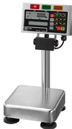
Рисунок 1 - Общий вид весов FS

Общий вид весов представлен на рисунке 1.