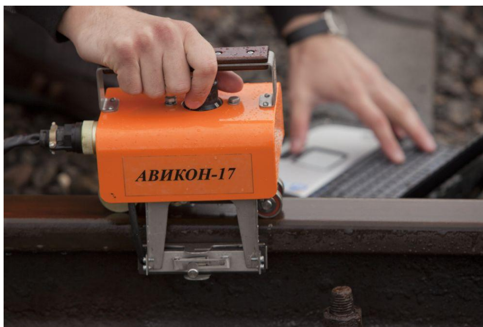
Рисунок 1 - Общий вид дефектоскопов.

На рисунке 1 представлена фотография общего вида дефектоскопов.