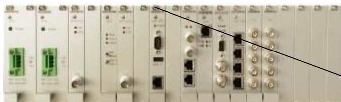
Метроном версии 900