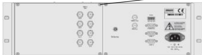
Метроном версии 3000