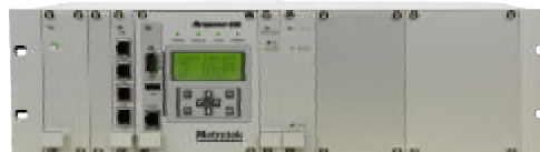
Метроном версии 900