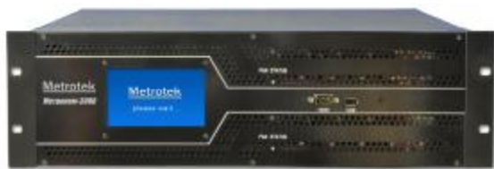
Рисунок 1 Общий вид источников отдельных версий (продолжение)