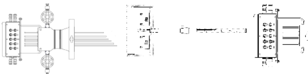
Рис.3 – Датчики температуры модели TTSP-XXXXXX