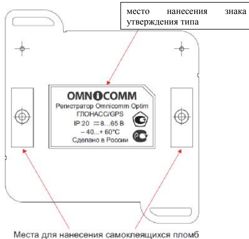
Рисунок 2 – Внешний вид аппаратуры Omnicomm Optim