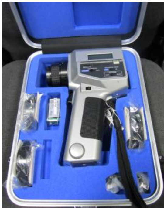
Рисунок 1 - Общий вид яркомера LS-110 в кейсе