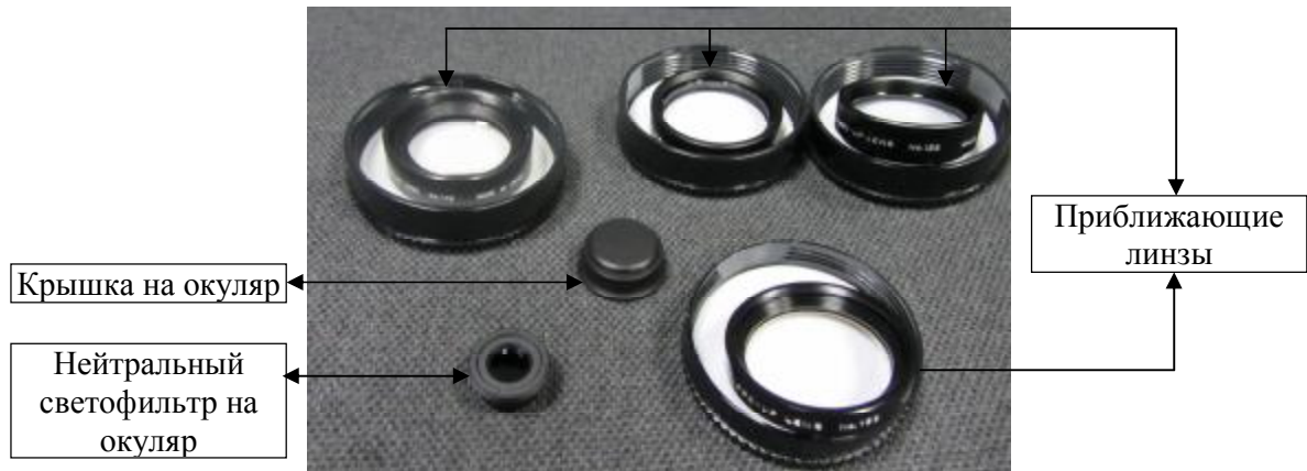
Рисунок 3 – Комплектующие яркомера LS-110