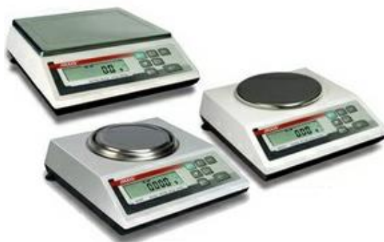
Рисунок 3 – Общий вид весов