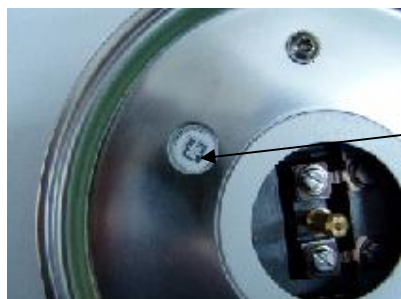
Рисунок 1 - Схема пломбирования весов от несанкционированного доступа

Пломбировка контрольной этикеткой винта стяжки корпуса