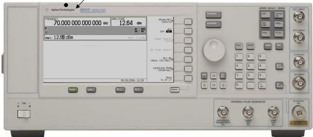
Рисунок 1 - Внешний вид лицевой панели генераторов сигналов Agilent E8257D