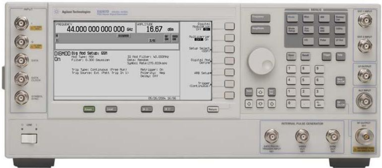
Рисунок 2 - Внешний вид лицевой панели генераторов сигналов Agilent E8267D