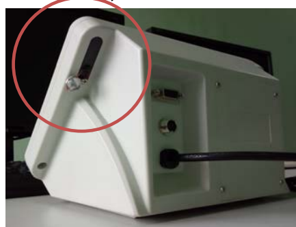
Прибор весоизмерительный КСК18

Рисунок 2 - Схема пломбировки от несанкционированного доступа Форма маркировки весов: МВСК-УВ Мах - N - X, где Мах - значение максимальной нагрузки весов: 15, 25, 30, 40, 60, 80, 100 т; N - длина ГПУ, м; X - тип датчика: C11, RC3, ZS.