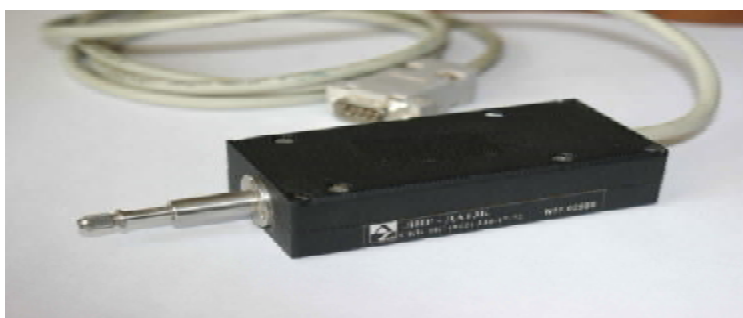
Рисунок 5 Внешний вид преобразователя ЛИР-ДА13Б