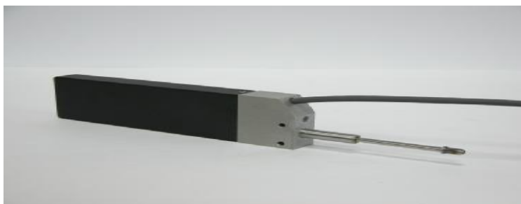
Рисунок 3 Внешний вид преобразователя ЛИР-17