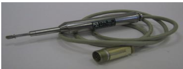
Рисунок 4 Внешний вид преобразователя ЛИР-19А в исполнении 1