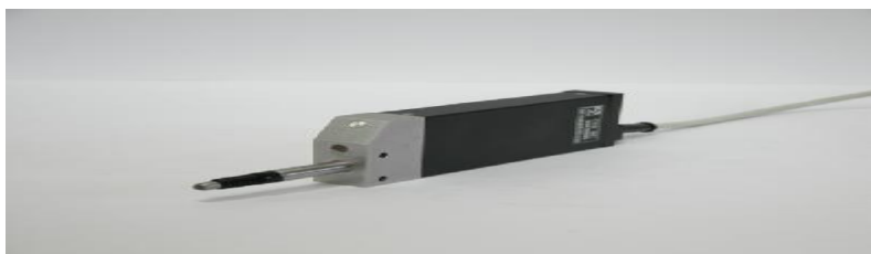
Рисунок 1 Внешний вид преобразователя ЛИР-14 с гофром на штоке

На рисунке 1 показан внешний вид преобразователя ЛИР-14 с гофром на штоке, на рисунке 2 – внешний вид преобразователя ЛИР-15, на рисунке 3 – внешний вид преобразователя ЛИР-17, на рисунке 4 - внешний вид преобразователя ЛИР-19А в исполнении 1, на рисунке 5 - внешний вид преобразователя ЛИР-ДА13Б.