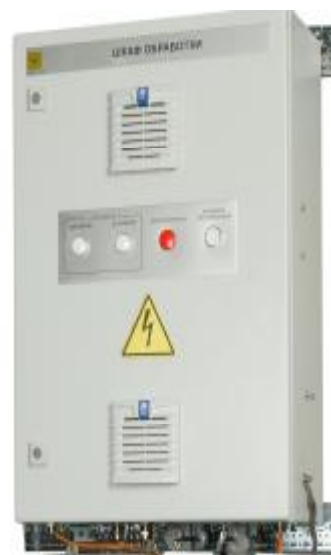
Шкаф обработки подсистемы сбора информации (ШО)