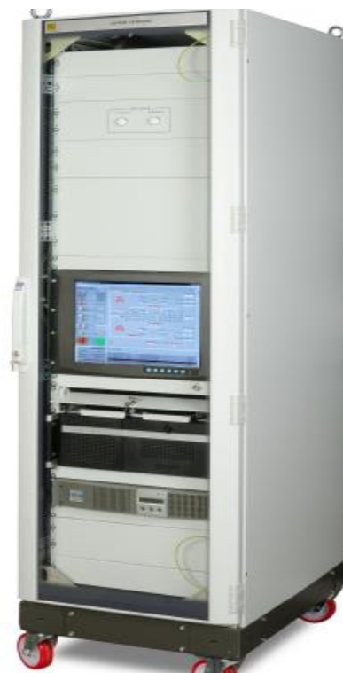
Шкаф сервера (ШС)