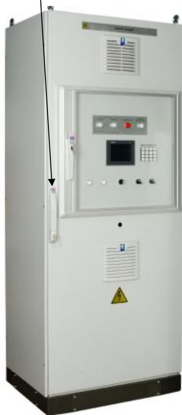
Шкаф защит электронного автомата безопасности (ШЗ)