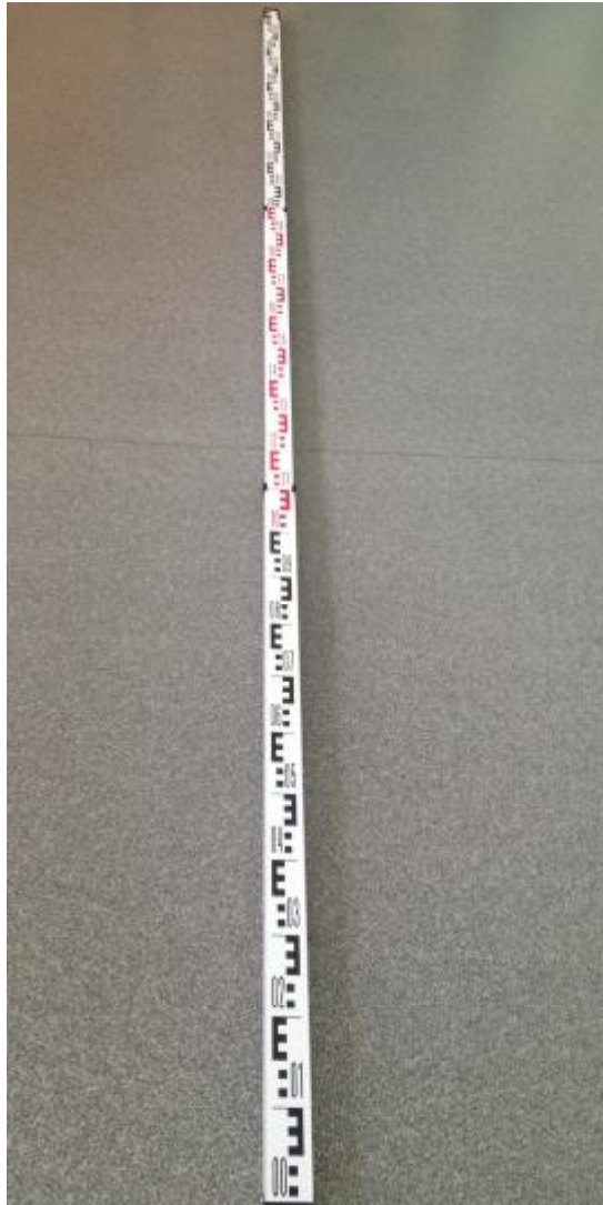
Рисунок 2 - Внешний вид рейки