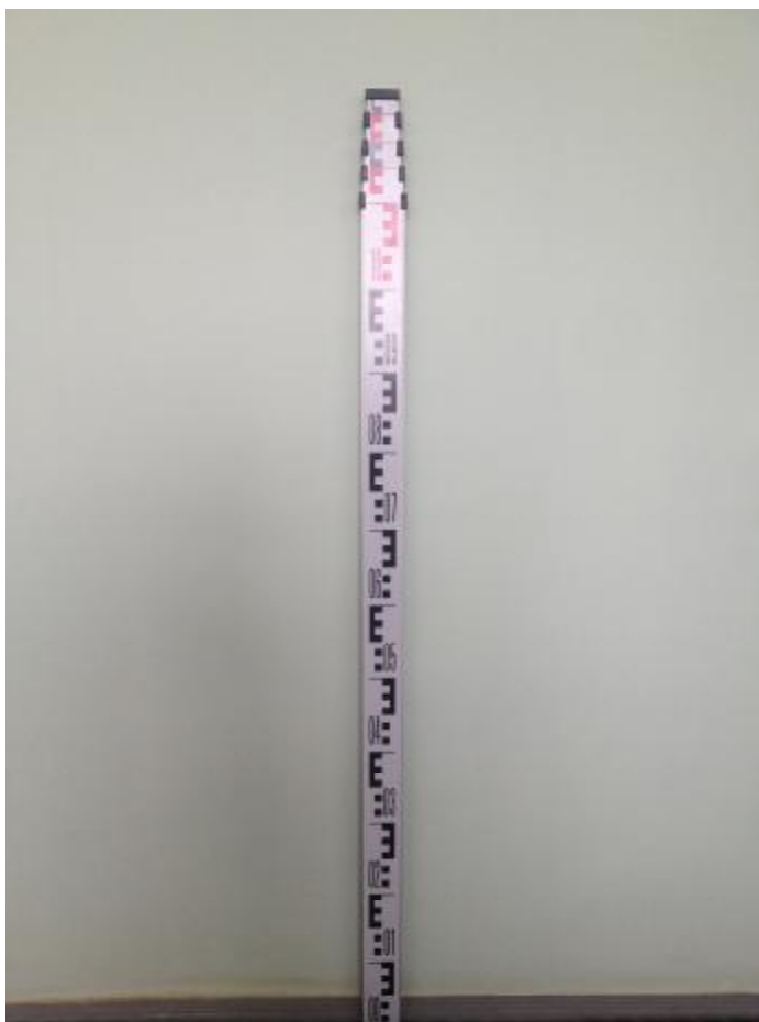
Рисунок 1 - Внешний вид рейки

Схема обозначения мест для размещения наклеек приведена на рисунке 5.