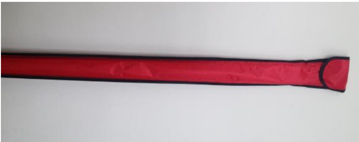
Рисунок 3 - Внешний вид защитного чехла