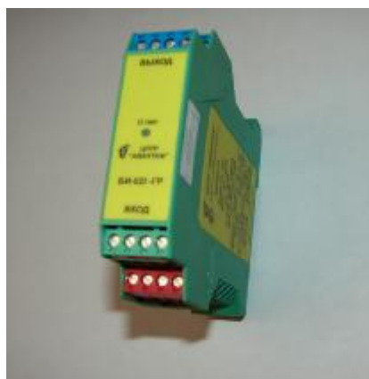
Рисунок 2 — Внешний вид модификации БИ