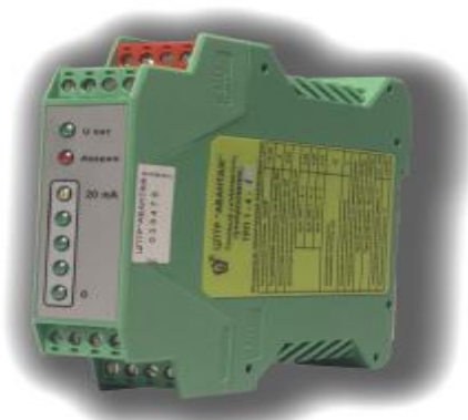
Рисунок 3 — Внешний вид модификации ТРП