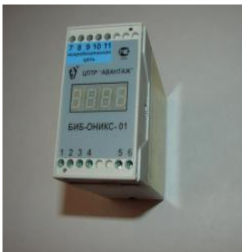
Рисунок 1 — Внешний вид модификации БИБ

На рисунках 1-3 изображен внешний вид модификаций преобразователей «ИПР».