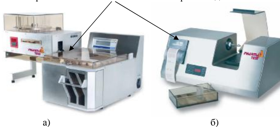
Рисунок 2 – Внешний вид установки а) WHT 3ME, б) PTB 302, PTB 502

Место нанесения поверительного клейма или знака поверки в виде наклейки