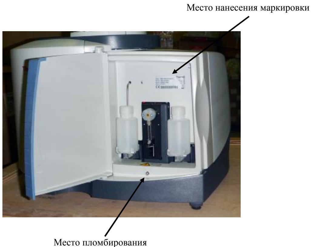
Рисунок 2 – Места нанесения маркировки и пломбирования